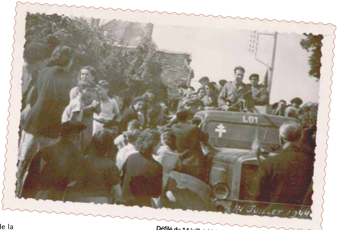
Défilé du 14 juillet 1944 (lieu non identifié) - AD46 73 J 73 |

« Au cours du jeu, il va falloir retrouver en équipe les documents sur lesquels j'ai travaillé », explique-t-elle. Une manière inédite de découvrir les richesses des Archives départementales, le travail de recherche et l'histoire du Lot au cours de cette période.