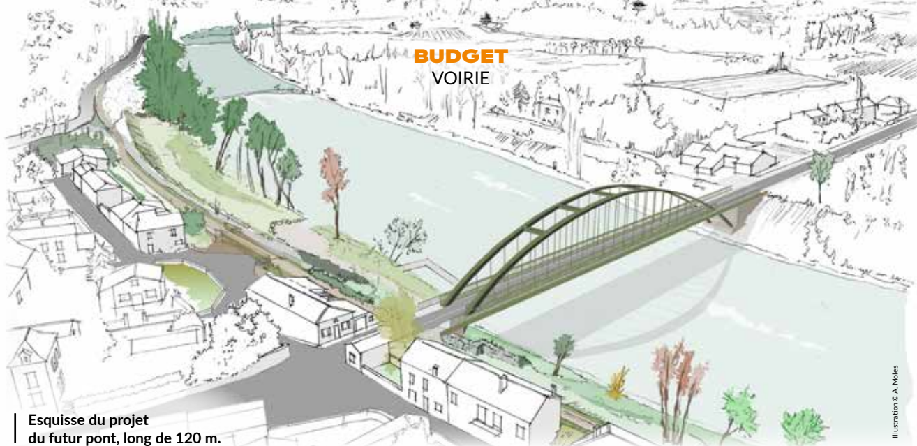
Esquisse du projet du futur pont, long de 120 m.